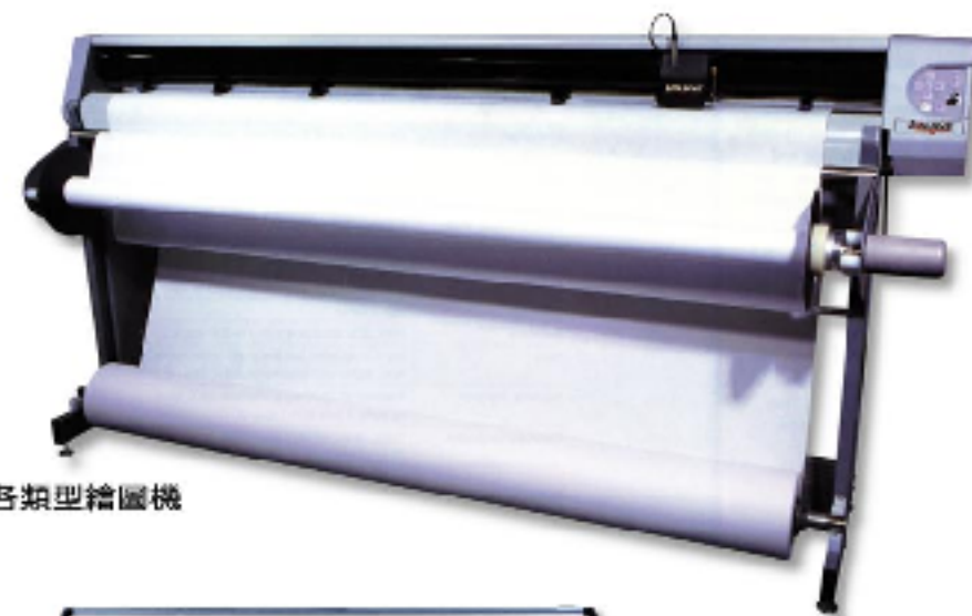
支援各類型繪圖機