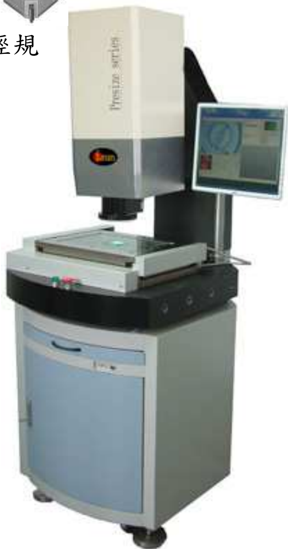
三次元影像測量機