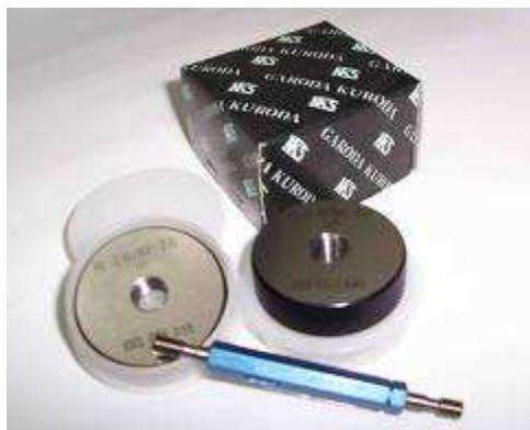
各式KKS公母牙規、環規