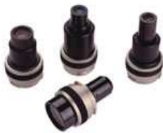
10X, 20X, 50X, 100X 可互換物鏡