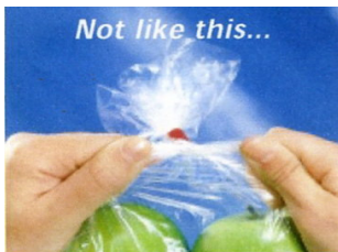
不用這樣生氣拉扯