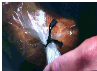
無須用金屬束帶扭來轉去