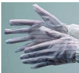
SG-001 抗靜電手套 包裝方式：10 雙 / 包、50 包 / 箱 SIZE：S / M / L