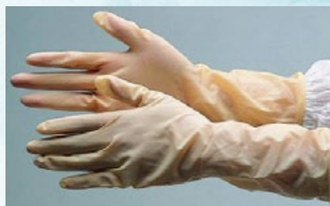
SG-002 乳膠手套 包裝方式：50 雙 / 包、10 包 / 箱 SIZE：9" S / M / L、12" S / M / L