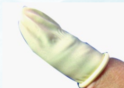
SG-004 手指套 包裝方式：1440 個 / 包、20 包 / 箱 SIZE：S / M / L