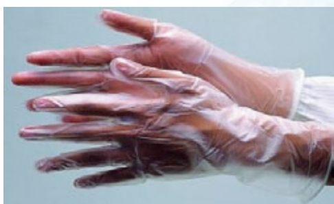
SG-003 PVC 手套 包裝方式：50 雙 / 包、10 包 / 箱 SIZE：9" S / M / L、12" S / M / L