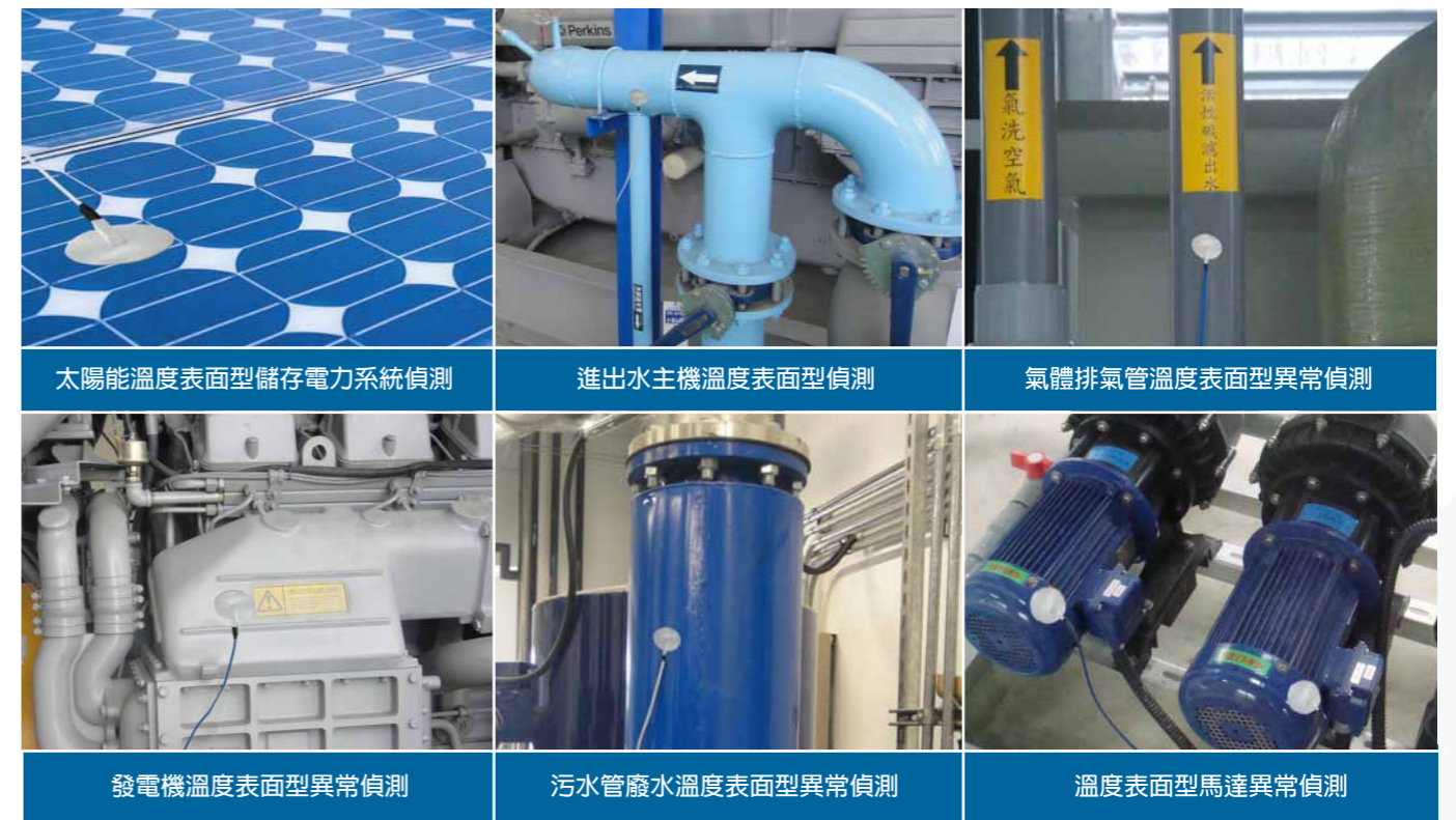
太陽能溫度表面型儲存電力系統偵測