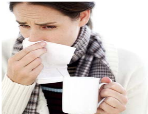
cGMP Western Medicine

NEW CHEMICAL & PHARMACEUTICAL LABORATORY CO LTD