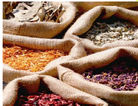
GMP Chinese herbal medicine