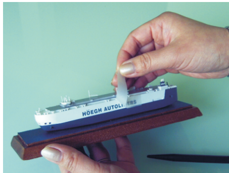
◎將轉印紙慢慢的撕開檢查圖案是否轉寫完整,如有未印好的部份請再放下轉寫紙,再度重點刮印。