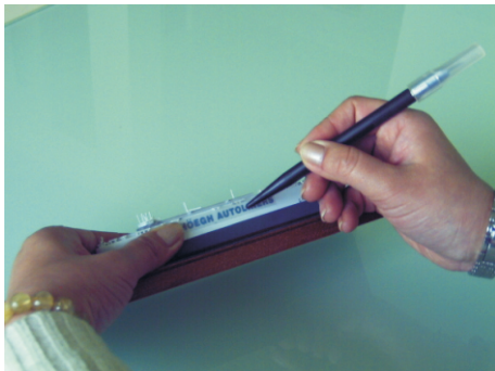
◎將要轉印的圖案用轉印棒加壓刮印,當圖案顏色變淡即表示已印好完成。