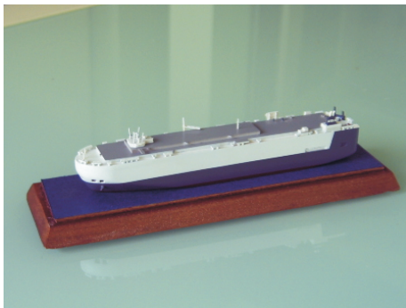
◎將開模成型的產品外殼底漆噴好。