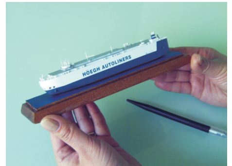
◎轉寫完成後請再用離型保護底紙再次加壓(光滑面向下),可使轉印更平坦,附着力更好。