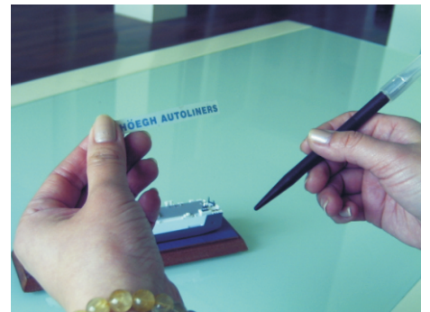
◎將轉寫紙對準好位置,輕按空白位置避免轉寫紙移動。