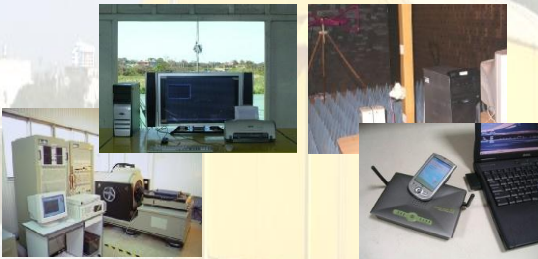
SRT服務產品類別 (Category of products serviced by SRT)

SRT:建立於1990 ( MD/USA) 技術主管: 超過32年EMC/ RF 經驗