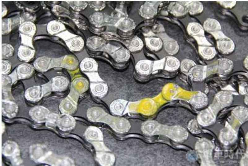
緊目的鏈條經過機器標示後，無所遁形