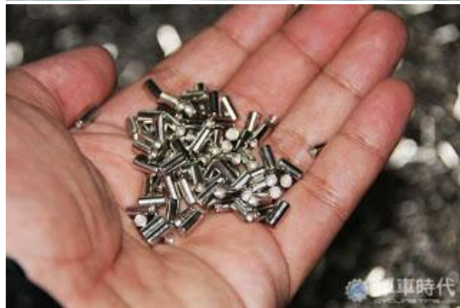
亮晃晃的外片與小軸最初的原型