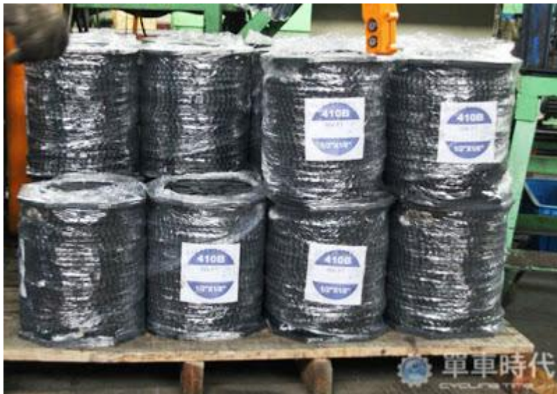
也有的車隊會選擇購入整捆的鏈條自行分裝，是不是很有家庭號的感覺呢