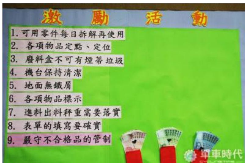
看著牆上的標語佈置，對出廠的產品要求在此可見一斑

這裡的每組鏈條，從進料、檢驗、複驗，都經過重重考驗；工作人員會追蹤鏈條的批號，並進行電子建檔的工作，經過記錄後，鏈條就像有了出生證明，也能控管每個環節的品質。