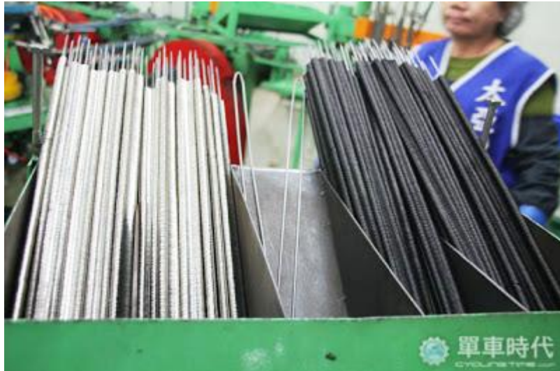
經整列機整理過的內、外片，井然有序

完成整列的工作，就可以來到下一關「目視平台」，在這裡，工作人員會悉心的檢查鏈條的原料配製是否正確，通過嚴密的審查，鏈條才能進行鉚合的動作。