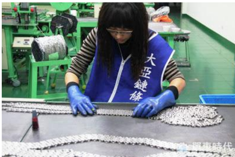
由於鏈條的生產過程都已經機械化， 細節部分必須經過人力手工篩選，確認品質。

鉚合是在鉚釘機進行，這個步驟是讓鏈條俱備拉力與強度的關鍵；像 Deca-101 (UL) 10 速鈦鑽鏈條，就採用了 360 度環形鉚合設計，鉚合力達到 250Kgf，配合內斜橋專利，強化鏈條的拉力及側向結構。