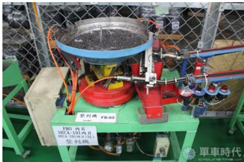
漏斗狀的整列機，透過不斷震動，讓原料各就各位

藉由整列機不斷的震動，可以幫助鏈條的原料一片片排排站好，就定位以後通過整列機，就可以整理成整串的原料；雖然是簡單的原理，看著原料一一整齊入列，還是覺得相當神奇。