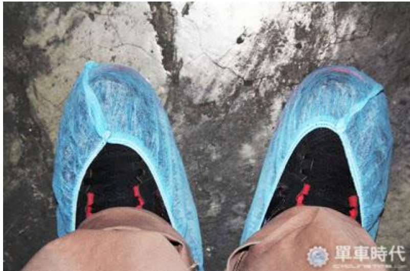
特製的鞋套保持地板的清潔，有效隔絕部分的灰塵

承接日本工藝，精品區的設立，是大亞鏈條董事長吳華田堅持根留台灣開發出的自動化設備，除了為產品嚴格把關，選擇本土經營，也體現出照顧員工的堅持。