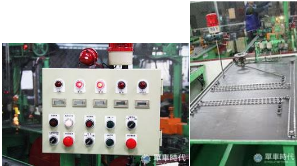
過程中，有任何問題機器都會發出警示燈號

檢驗可沒有這麼容易過關，鏈條最怕有活動不自然（又稱緊目）的問題，當預拉完成的鏈條通過「自動檢驗機」，機器會檢測出不合格的产品，以紅黃雙色表示，讓工作人員立即汰除，無論是缺件或鉚合不良的产品，都過不了這一關！