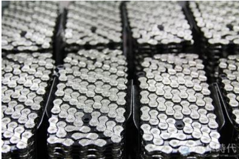
分裝中的鏈條，品質確認沒問題候才能送至包裝的程序