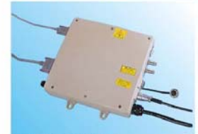
◎可避免高溫與震動影響