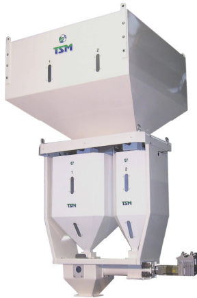
TSM CONTINUOUS GRAVIMETRIC BLENDER