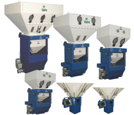
THE TSM BLENDER RANGE

所有 TSM 的批次式計量混料機，皆以耐衝擊的鋼板結構設計可抵抗外界操作環境的干擾，經過特殊設計的秤重元件，可避免受汙染以及破壞，以確保每批次計量的精準度。