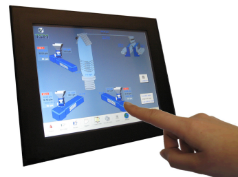
CP 9000 SUPERVISORY SYSTEM

此系統的中央操控介面可整合各押出機產線，區域網路內的伺服器會蒐集原始數據，以提供各物料相關報告、警報記錄、各配方內容，經由網路連結，用戶端在 Windows NT/2000/XP 作業系統下，可由各計量混料機、感測器、控制器下載 / 查