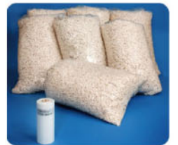
一捲Novus Double Cushion膠膜相當於14立方呎的乖乖粒