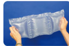
CELL-O® 8x8 cushion

小型的空氣枕，專門針對小型箱內固位與填充之用。適用於汽機車零件、運動器材或非易碎之產品。