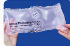
NOVUS® Double Cushion

可摺疊的雙向空氣管柱，適用於箱內列狀空間、角落纏繞或折疊之產品固位，特別針對陶器、玻璃器皿或電子產品等易碎之包裝物使用。