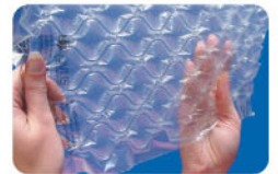
NOVUS® Quilt Small

中型空氣枕，適用於填充紙箱內的中、大型空間。適用於五金工具、機器零件、鞋類、家庭用品以及非脆弱性之產品。