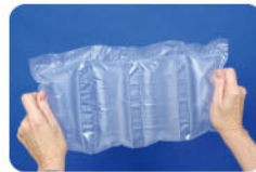
CELL-O® 4x8 cushion

如同大型氣泡布，提供雕刻品、大型碗盤器皿與玻璃、蠟燭、輕型零配件、音樂器材配件或其他中大型項目等包裝解決方案。