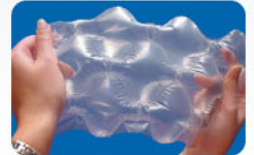
NOVUS® Quilt Large

大型氣墊，適用於頂部以及側邊空間填塞之用，可使用較少之包裝材料，得到較佳的緩衝效果，適合書本包裝使用。