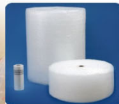
一捲Quilt-Air large膠膜相當於1.33捲1.22m×6.2M的氣泡布

等同於小型氣泡布，適用於小型的裝飾品或易碎品，可用來層層保護易碎器皿或其他平滑表面，避免物品的刮傷。