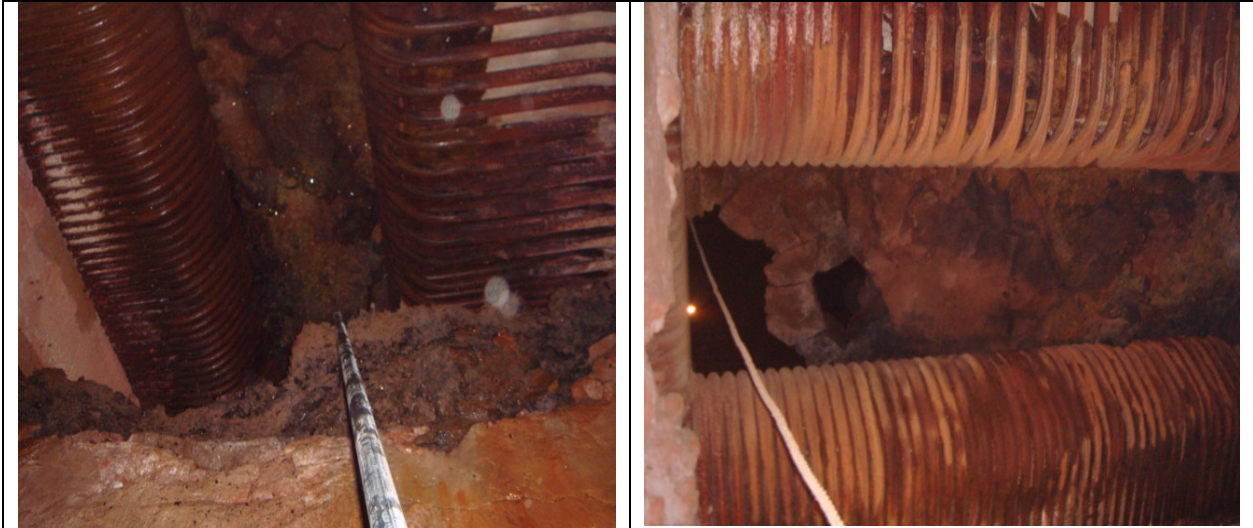
ATD 高壓鋼管深入 6m 高度