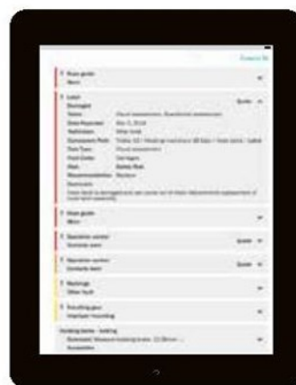
针对完成的服务活动的风险评估和建议可以随时在科尼客户门户网站 yourKONECRANES.com上查看。

我们使用这种方法来评估和优先考虑安全风险、生产风险和不能确定的状况，以此识别各种改进机会。我们会通过顾问式的回顾方法提供建议，以改善您的安全性及生产效率。