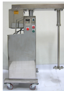
油壓昇降高速攪拌機 1200 / 5000rpm 機種: 3HP ~ 30 HP