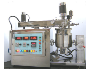
實驗型高速真空乳化攪拌機 10000 / 12000rpm 機種: 3L ~ 10L