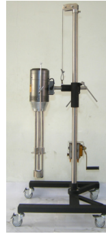
高速乳化均質機 8000rpm 機種:50~100L