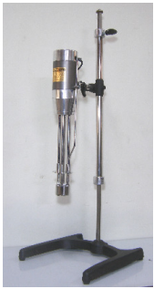
高速乳化均質機 12000rpm 機種:20L