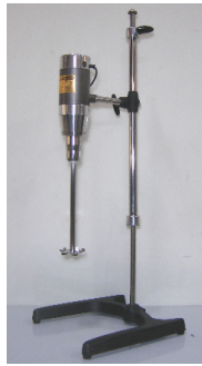
高速攪拌均質機 9000rpm 機種:20L