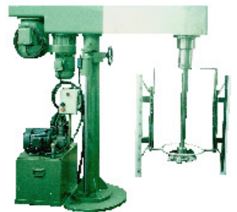
高/低速雙攪拌機 H-1200rpm / L-60rpm 機種: 7.5HP ~ 30 HP