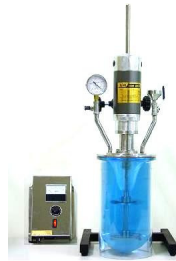
實驗型真空脫泡攪拌機 3000rpm 機種:1.5~3L