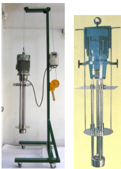
懸吊式乳化均質機 3600rpm 機種: 3HP ~ 30 HP