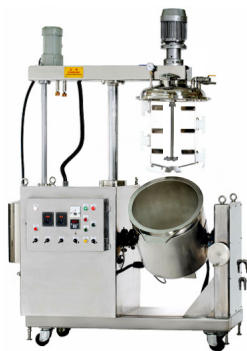
真空製膏攪拌機 機種: 20Kg ~ 500Kg