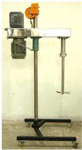
攪拌機(手動昇降) 1200~3000rpm 機種: 1HP~ 2HP