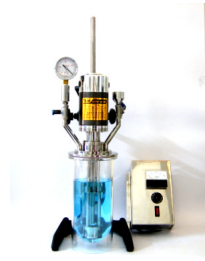
實驗型高速真空乳化機 12000rpm 機種:1.5~3L