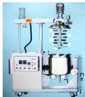
高速真空乳化攪拌機 機型: 3600 / 6000rpm 機種: 20L ~ 500L