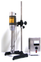
實驗型高速乳化均質機 12000rpm 機種: 2~5L