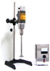
實驗型高速攪拌均質機 7000or10000rpm 機種:5L