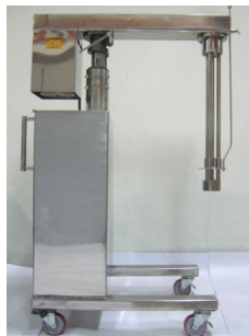
動力昇降高速乳化機 3600 / 8000rpm 機種: 3HP ~ 30 HP